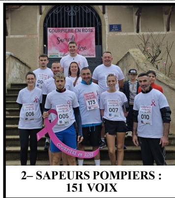
2- SAPEURS POMPIERS : 151 VOIX

La ligue contre le cancer nous communiquera prochainement le montant des sommes récoltées et une remise de chèque officielle sera organisée en Mairie.