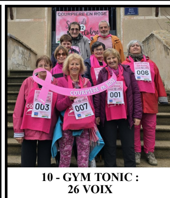
10 - GYM TONIC : 26 VOIX