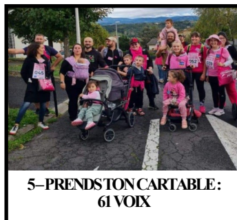
5- PRENDSTON CARTABLE : 61 VOIX