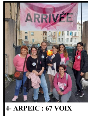
4- ARPEIC : 67 VOIX