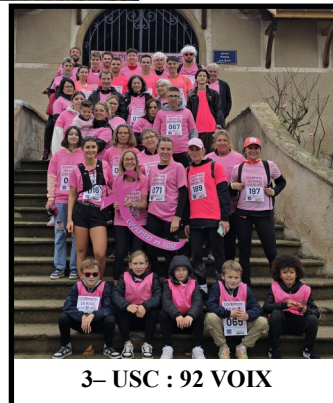
3- USC : 92 VOIX