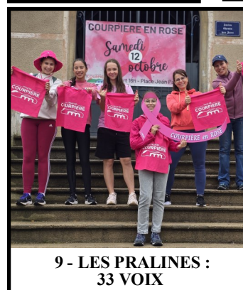
9 - LES PRALINES : 33 VOIX