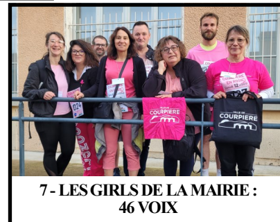
7- LES GIRLS DE LA MAIRIE : 46 VOIX