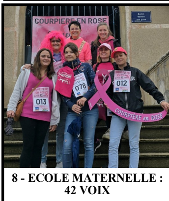
8 - ECOLE MATERNELLE : 42 VOIX