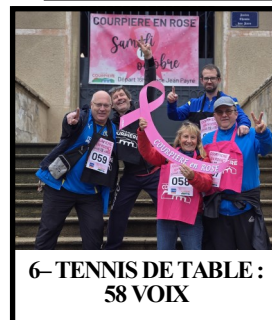
6- TENNIS DE TABLE : 58 VOIX