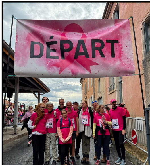
1- LES CANOTIERS : 238 VOIX

N° 39/2024 du 31 octobre au 7 novembre 2024