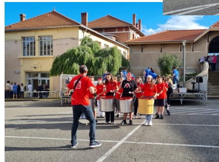
Batucada de l'ISP