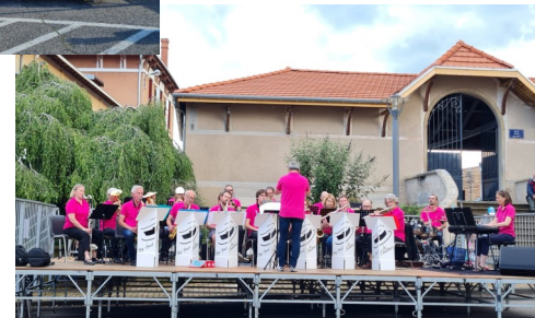
Big Band des Canotiers