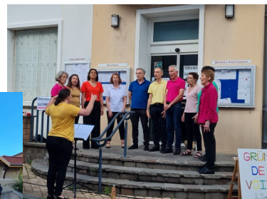
Chorale Grün de Vie