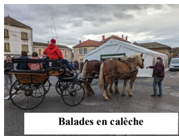
Balades en calèche