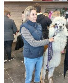
La ferme des Touminis Ferme pédagogique