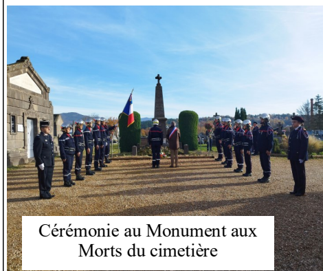
Cérémonie au Monument aux Morts du cimetière