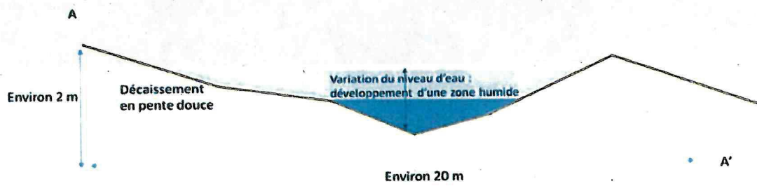
Figure 1 : Profil type de la zone humide compensatoire