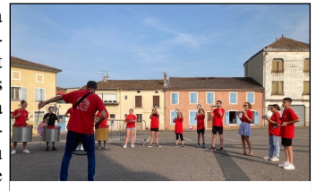
LA BATUCADA DE L'ISP

La Municipalité tient chaleureusement à remercier tous les artistes qui ont participé à cette soirée et particulièrement La Batucada de l'ISP et Les Canotiers qui nous ont fait le plaisir d'animer la première partie de soirée sur l'esplanade de la mairie. Merci également au restaurant les Seychelles qui a accepté de tenir une buvette tout au long de la soirée pour permettre aux spectateurs de