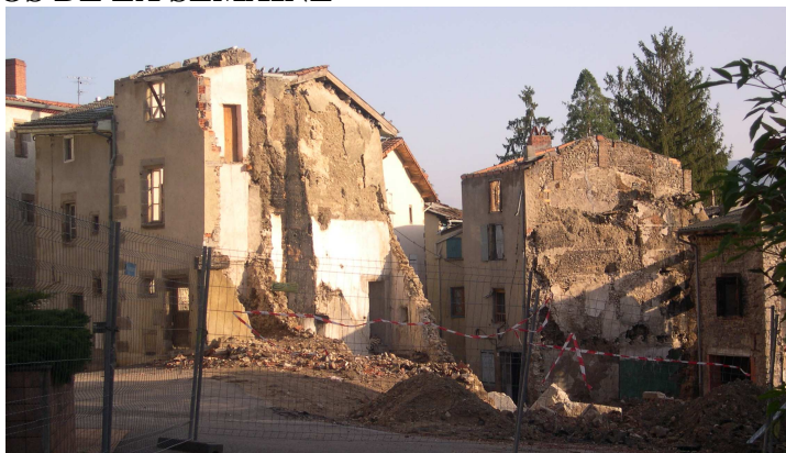
Suite du chantier de démolition de l'îlot de l'Antiquité