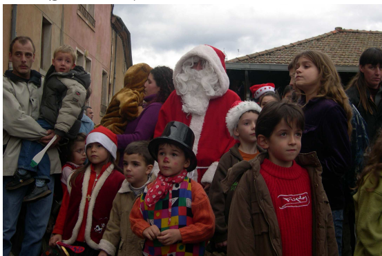
Les enfants de Courpière ont réveillé le Père Noël, le samedi 2 décembre 2006