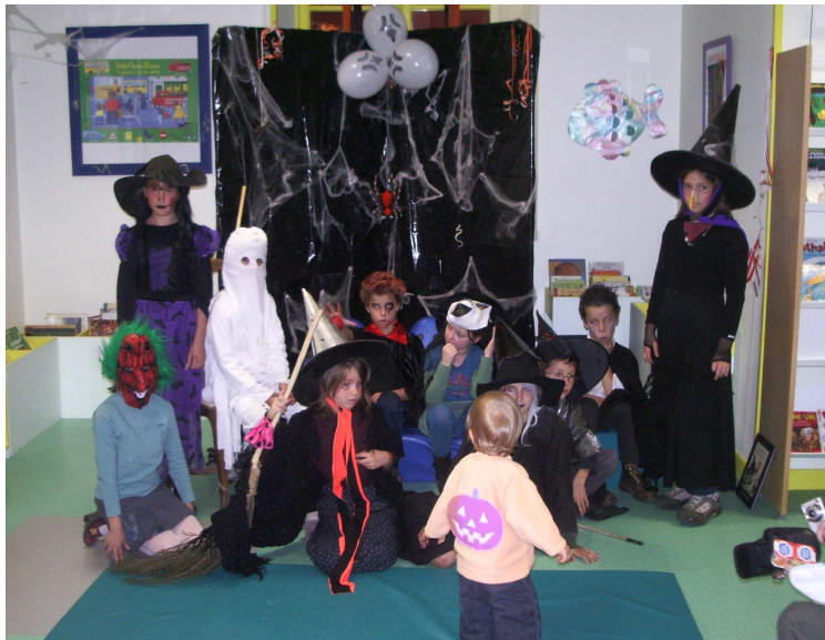
Fête d'halloween à la bibliothèque municipale de Courpière du mardi 31 octobre 2006.