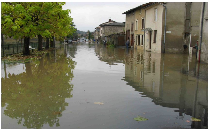
La rue Honoré de Balzac sous les eaux.