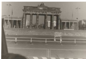
Porte de Brandebourg à Berlin. Photo souvenir d'un Courpiérois en 1973.