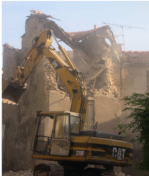
Démarrage des travaux de démolition de l'îlot de l'Antiquité.