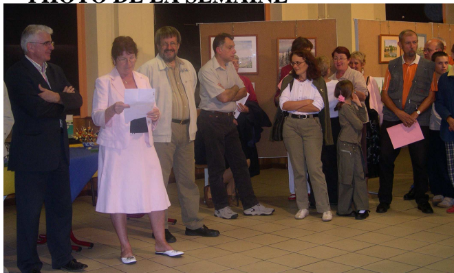
Vernissage de l'exposition d'automne de l'association ARC EN CIEL