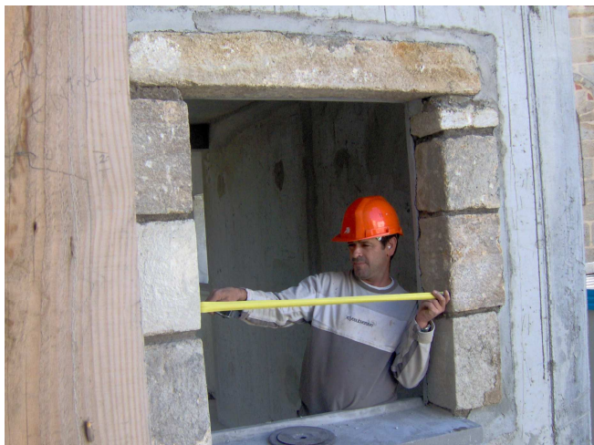
Encadrement de fenêtre de l'Ilot de l'Antiquité