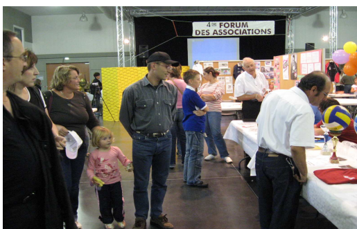
4ème Forum des Associations Samedi 8 septembre