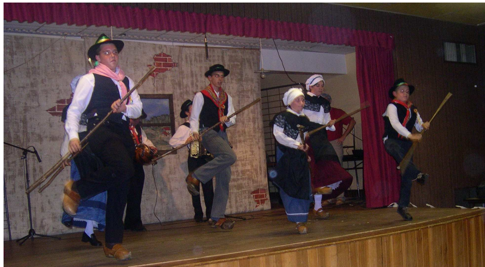
Énorme succès de la Soirée Patois, organisée par l'A.C.P.