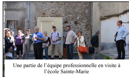
Une partie de l'équipe professionnelle en visite à l'école Sainte-Marie

Samedi 8 septembre, le local vous sera également ouvert toute la journée, de 10h à 18h. L'équipe de Hugo Receveur se fera un plaisir de vous y accueillir pour réfléchir avec vous à l'avenir du centre-bourg.