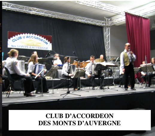
CLUB D'ACCORDEON DES MONTS D'AUVERGNE