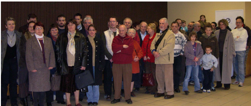
Le 3 février 2007 : Réception des nouveaux arrivants 2006